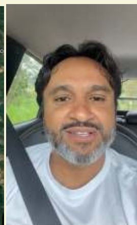
Sindicato pressiona a empresa há vários anos pelo transporte para Cachoeira do Campo

demais linhas, para o pessoal do turno, serão implementadas após levantamento de demanda. Para isso, os trabalhadores devem entrar em contato com a Samarco para atualizar o endereço e confirmar que moram em Cachoeira do Campo.