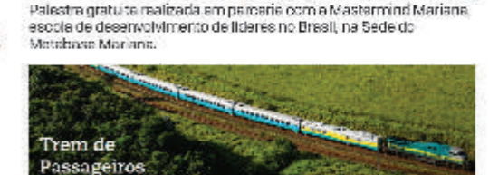
Passagem de trem gratuita para aposentados de empresa Vale. Mais uma conquista do Sindicato Metabase Mariana.