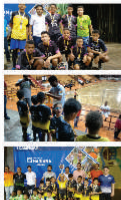
Metabase Mariana patrocinando 1ª Liga de Futebol. Campeonato que reuniu mais de 700 jogadores de todas as idades e sexos na cidade de Mariana.