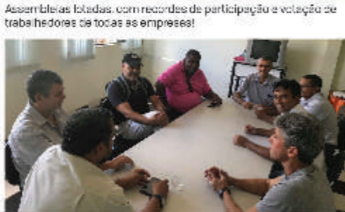
Posse do nosso amigo e parceiro UFT, da União Geral dos Trabalhadores (UGT), que agora é nosso assessor político-administrativo.