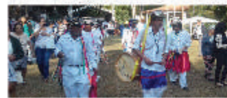
Congado Nossa Senhora do Rosário e Nossa Senhora Aparecida, que sempre conta com o apoio do Sindicato para suas brilhantes apresentações culturais na região.