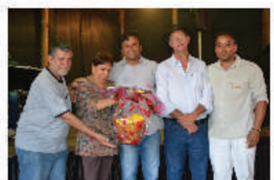
Sortido da brincadeira, palestras e muita alegria.