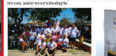
Festa dos Gringos realizada pelo Sindicato Metabase Mariana em Santa Bárbara em 2017.