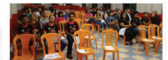
Palestra gratuita realizada em parceria com a Mastermind Mariana, escola de desenvolvimento de líderes no Brasil, na Sede do Metabase Mariana.