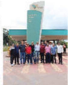
Reunião realizada em Itabira-MG. Uma conversa enriquecedora para estabelecer estratégias para o futuro, com o intuito de construção de uma mesa unificada da negociação.