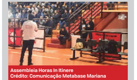
Assembleia Horas In Itinere

Durante todo esse tempo, o Metabase esteve lutando arduamente ao lado dos funcionários da Samarco, oferecendo apoio jurídico, além de ofertar cursos voltados para colaborar com a profissionalização da categoria, buscando a capacitação da mão de obra para futuras vagas de emprego - sempre lutando pela retomada das atividades da empresa com suas devidas responsabilidades.