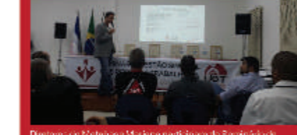
Distância do Metabase Mariana participando do Seminário do Centro Sindical "Nos Retorno Trabalho", no EPTC do Santo, promovido pelo Unasind - Instituto de Estudos (UNASIND).