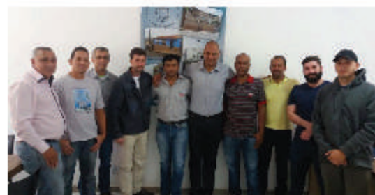
Metabase Mariana apoiando novos projetos esportivos em parceria com o Sindicato dos Rodoviários.