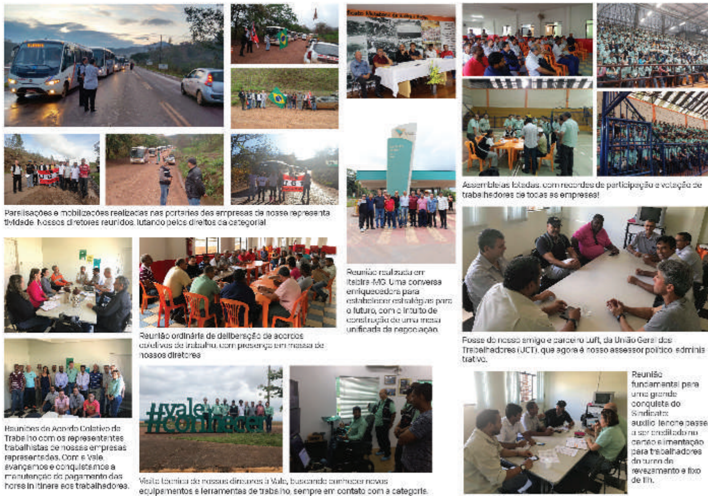
Paralisações e mobilizações realizadas nas portarias das empresas de nossa representatividade. Nossos diretores reunidos, lutando pelos direitos da categoria!