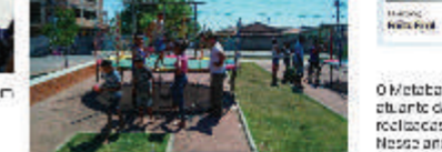
O Metabase Mariana foi eleito como o Sindicato mais atuante da cidade na última eleição promovida pelas eleições para o cargo de presidente do Sindicato de Mariana. Nesse ano, estamos novamente entre os finalistas.