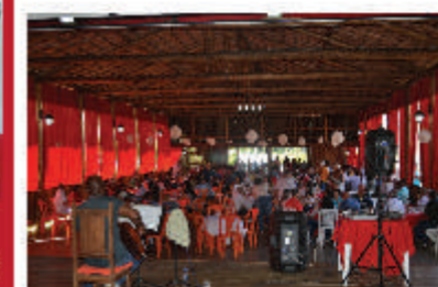
IV e V Encontro de Associações e Aposentados. Encontro realizado pelo Sindicato com o objetivo de promover a interação entre as associadas. Sortido da brincadeira, palestras e muita alegria.