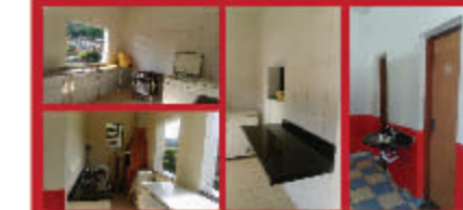
Reforma para melhorias no salão de festas do Sindicato para melhor atender as associadas. Também foram realizadas obras de melhorias no apartamento e na casa de praia do Metabase Mariana.