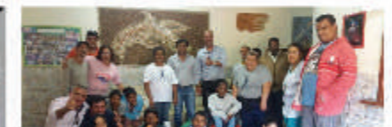
Filheta dos doadores recebidos durante o Torneio de Truco à Comunidade da Figueira.