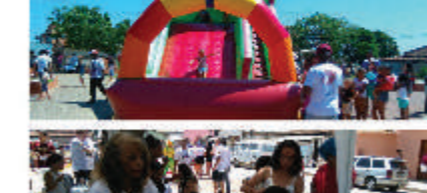
Festa dos Gringos realizada pelo Sindicato Metabase Mariana em Santa Bárbara em 2017. Uma parceria com a Rádio Truque de Santa Bárbara, e M5 Vitorreção, o Jornal Particípio e a OJC Sociedade Melhor.