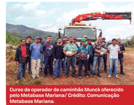
Curso de operador de caminhão Munk oferecido pelo Metabase Mariana/ Crédito: Comunicação Metabase Mariana.

de novos estabelecimentos conveniados ao Metabase oferecendo descontos exclusivos para nossos associados. Acordos coletivos participativos e com recordes de votação. Parcerias de sucesso com entidades da região. Novos processos abertos pelo setor jurídico do Sindi-