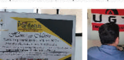
Festa dos Gringos realizada pelo Sindicato Metabase Mariana em Santa Bárbara em 2017.