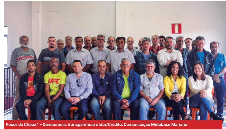
Posse da Chapa 1 - Democracia, transparência e luta