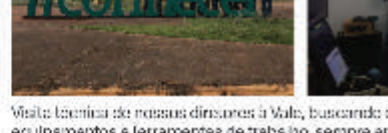
Reunião realizada em Itabira-MG. Uma conversa enriquecedora para estabelecer estratégias para o futuro, com o intuito de construção de uma mesa unificada da negociação.